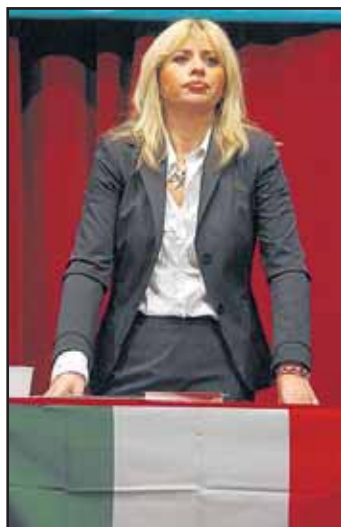
La néofasciste Alessandra Mussolini a rejoint Berlusconi.