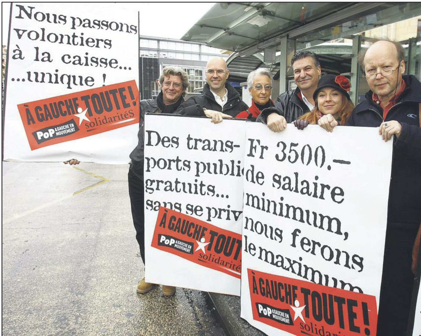
Campagne de la coalition «A gauche toute!» en 2007 à Lausanne: des revendications qui ont «renchéri» depuis lors.

Certaines sections cantonales restent bien vivantes, notamment celle de Neuchâtel, surtout dans les Montagnes. On observe un renouvellement et un rajeunissement des militants dans le Parti ouvrier et populaire (POP) vaudois. A Genève, la «gauche de la gauche» pourrait